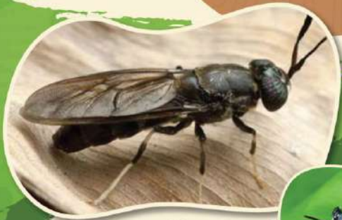
แมลงทหารดำ (Black Soldier Fly : BSF)

มีชื่อวิทยาศาสตร์ว่า Hermetia illucens ในประเทศไทยมีชื่อเรียกหลายชื่อ เช่น แมลงวันลาย แมลงวันทหารดำ แมลงทหารเสือ แมลงโปรตีน หนอนแม่โจ้ เป็นต้น พบได้ทั่วไปตามธรรมชาติ ชอบอยู่ในสภาพภูมิอากาศเขตร้อนชื้น และเขตร้อนชื้น ไม่เป็นพาหะนำโรคและไม่เป็นศัตรูพืช