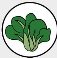
กวางตุ้ง