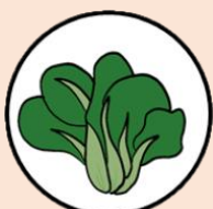
กวางตุ้ง