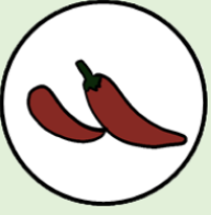
พริกชี้หนู