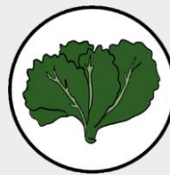
ผักกาดหอม