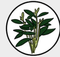
ผักบุ้งจีน