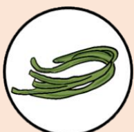
ถั้วฝักยาว