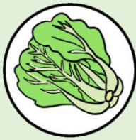
ผักกาดขาว