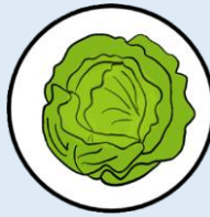
กะหล่ำปลี