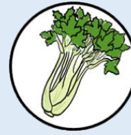
ขึ้นฉ่าย