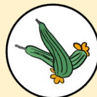
บวบเหลี่ยม