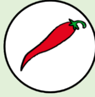
พริกชี้ฟ้า