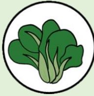
กวางตุ้ง