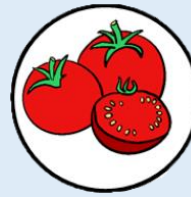
มะเขือเทศ