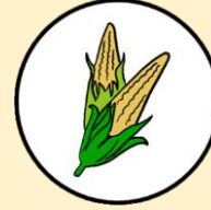
ข้าวโพดอ่อน