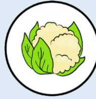
กะหล่ำดอก