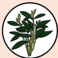
ผักบุ้งจีน