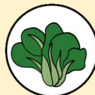
กวางตุ้ง