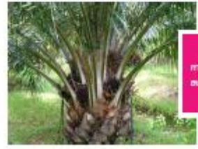
การให้น้ำระบบ สปริงเกอร์

การใช้ทะลายปล่าปาล์มน้ำมันไปคลุมดินบริเวณโคนต้นปาล์ม