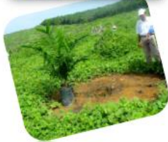
การปลูกปาล์มน้ำมัน

ควรเลือกต้นกล้าปาล์มน้ำมันที่แข็งแรง สมบูรณ์ มีอายุประมาณ 12-14 เดือน ทำการขนย้ายด้วยความระมัดระวังและนำไปปลูกในพื้นที่ที่เตรียมไว้