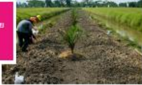
คลุมดินด้วย ฟางข้าว

คลุมดินด้วยฟางข้าวหรือใบหญ้าแห้ง หรือปลูกพืชตระกูลถั่ว คลุมบริเวณโคน ต้น ช่วยรักษาความชื้นในดินและรดน้ำให้ชุ่ม