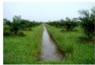
ควบคุมระดับน้ำในร่องให้มีสม่ำเสมอ

การให้น้ำสปริงเกอร์นั้น ต้องมีสระน้ำขนาดใหญ่เก็บไว้ในช่วงฤดูแล้งโดยต่อท่อวางระบบให้น้ำแบบสปริงเกอร์ โดยใช้หัวฉีด 1 หัว ในช่วงแรกของการเจริญเติบโตปีที่ 1-2 และใช้หัวฉีด 2 หัวต่อต้นในปีที่ 3 เนื่องจากปาล์มน้ำมันเจริญเติบโตเต็มที่เริ่มให้ผลผลิต มีความต้องการน้ำปริมาณมาก