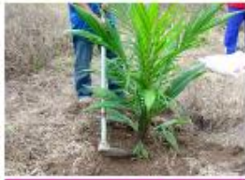
ใส่ดินลงในหลุม และอัดดินให้แน่น