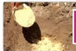
ใส่ปุ๋ยรอง กันหลุม

ใส่ดินลงไปหลุมโดยใส่ดินชั้นบนลงไปก่อน และอัดดินให้แน่น เพื่อป้องกันการล้มเมื่อลมพัดแรง