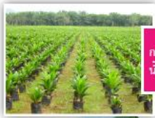
กล้าปาล์ม น้ำมัน