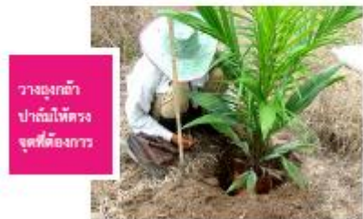
วางถุงกล้า ปาล์มให้ตรง จุดที่ต้องการ