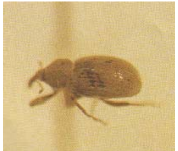
ตัวเต็มวัยด้วงวงกินรากข้าว H. molitor Faust

ทำลายข้าวโดยตัวหนอนกัดกินรากข้าว ทำให้ต้นข้าวเหี่ยวและแห้งตาย เนื่องจากรากข้าวถูกหนอนกัดกินจนหมด