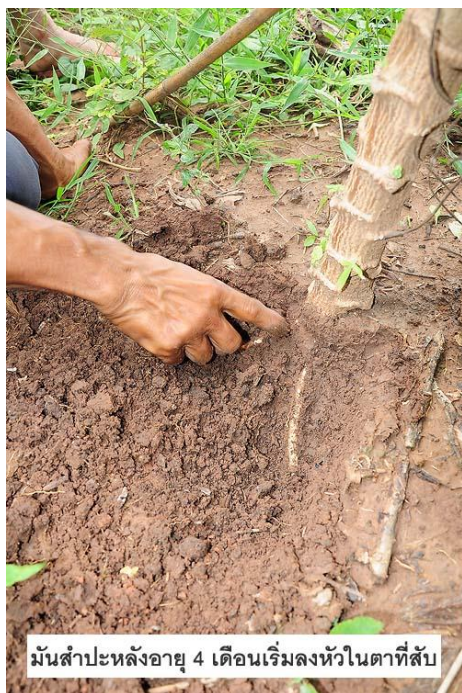
มันสำปะหลังอายุ 4 เดือนเริ่มลงหัวในตาที่สับ

ขั้นตอนการปลูกก็มีรายละเอียดที่น่าสนใจ โดยพันธุ์ที่คุ้นทองสุขใช้คือพันธุ์เกษตรศาสตร์ โดยการปลูกเริ่มจากการไถเตรียมดินแบบทั่วไป แล้วทำการยกร่องเป็นแนวยาวโดยไถเป็นร่องลึกประมาณ 1 ฟุต หรือ 30 เซนติเมตร จากนั้นก็วัดระยะต้น 1 x 1 เมตร ปักไม้เป็นเครื่องหมายไว้ นำปุ๋ยหมักที่ทำเตรียมไว้ใส่ลงไปร่องตามจุดที่วัดไว้ อัตรา 0.8 - 1 กิโลกรัมต่อหลุม แล้วทำการกลบดิน จากนั้นก็สามารถนำท่อนพันธุ์ที่ทำการสับตาไว้มาปลูกได้เลยทันที จากนั้นใช้แรงงานคนปักท่อนพันธุ์ลงบริเวณที่เราปักไม้และใส่ปุ๋ยไว้ โดยการปักต้องปักให้ตั้งตรงโดยไม่ต้องเอียง เพราะถ้าปักเอียงเหมือนเกษตรกรรายอื่นจะทำให้หัวมันออกไม่รอบกิ่งพันธุ์ ในส่วนของการใส่ปุ๋ยเคมีจะไม่มี การใส่อีกแล้วเพราะใส่ปุ๋ยหมักรองกันหลุมครั้งเดียวก็เพียงพอแล้ว วัชพืชก็ไม่ต้องกำจัดเพราะการที่เราใช้ท่อนพันธุ์ที่มีขนาดยาวทำให้เวลาปลูกสูงและวัชพืชโตไม่ทันมันที่เราปลูก ถ้ามีเพลี้ยแป้งหรือแมลงชนิดอื่น ๆ ระบาดก็ทำการฉีดพ่นด้วยน้ำส้มควันไม้ หรือน้ำหมักชีวภาพ