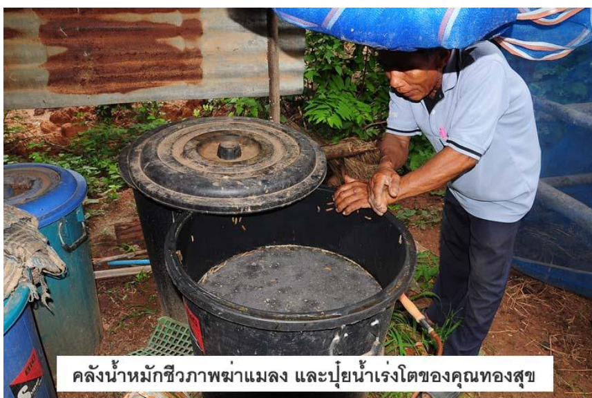
คลังน้ำหมักชีวภาพฆ่าแมลง และปุ๋ยน้ำเร่งโตของคุณทองสุข

3. หาวัสดุมาคลุมกองปุ๋ยไว้เช่น กระสอบปุ๋ย ทางมะพร้าว หรือผ้าพลาสติก ระหว่างกระบวนการหมักจะเกิดความร้อน ควรกลับกองปุ๋ยหมักทุกๆ 10 วัน และสังเกตดูเสมอมาความชื้นในกองเพียงพอโดยใช้มือจับดู ถ้ายังชื้นเมื่อบีบแล้วจะรู้สึกว่ายังชื้นวัสดุยังจับตัวกัน แต่ถ้าความชื้นไม่พอควรรดน้ำลงไปแต่อย่าให้แฉะ กระบวนการหมักจะใช้เวลาประมาณ 30 – 45 วัน ก็สามารถนำไปใช้ได้