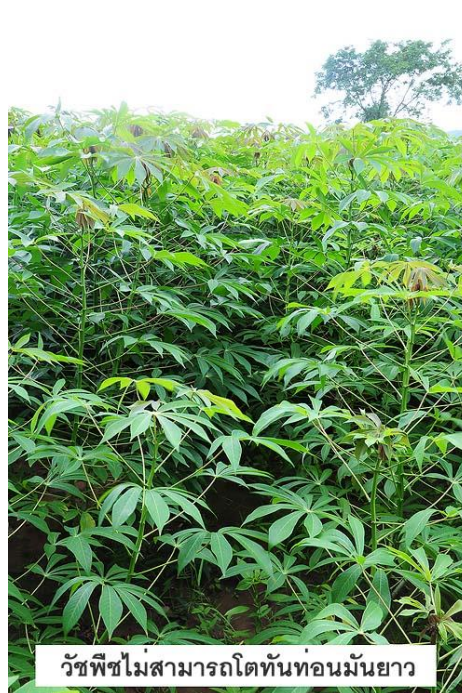
วัชพืชไม่สามารถโตทันท่อนมันยาว