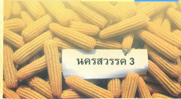
นครสวรรค์ 3